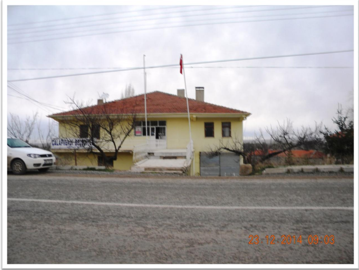
Belediye Hizmet binası