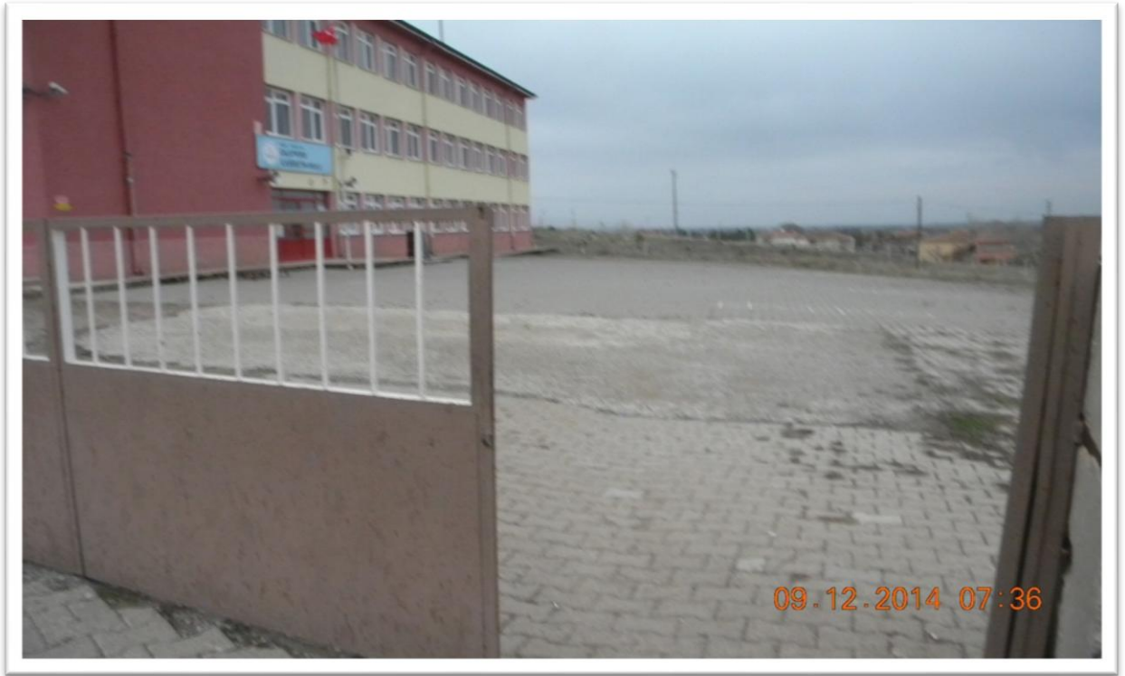
2004 Yılında yapılan okul binası

Kasabada bulunan İLKOKULU- ORTAOKULU1936 yılında hizmete girmiş olup, 1951 yılına kadar mezun olanlar 3.sınıftan 'şahadetname' aldıklarından sayıları tam olarak resmi kayıtlardan anlaşılmamaktadır. 1951-1952 eğitim-öğretim yılından 1996-1997 yılı sonuna kadar 1693 öğrencinin mezun olduğu resmi kayıtlardan anlaşılmaktadır. 2004 yılına kadar hizmet veren olan okul 1974 yılında Amerikan tipi olarak yapılmıştır. Şu an hizmet vermekte olan okul 2004 yılında eğitim öğretime açılmıştır. Okul bünyesinde 9 sınıf mevcut olup müdür odası, müdür yardımcısı odası, öğretmen odası, araç-gereç odası, harita odası, TV odası, fen sınıfı, kütüphane, çok amaçlı salon, mutfak, hizmetli odası olarak çok yönlü hizmet vermektedir. Okulda şu an 11 öğretmen, 1 müdür, 1 müdür yardımcısı 2 hizmetli görev yapmaktadır.